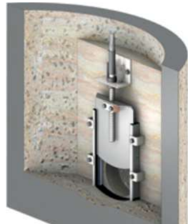
Saracinesche – Paratie - Valvole